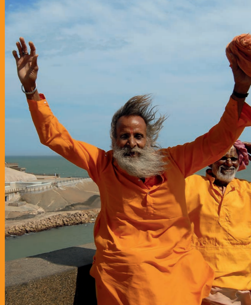
Konzeption: BUEROZITI.DE

Besuchen Sie uns auch auf WWW.FACEBOOK.COM/RJMKOELN